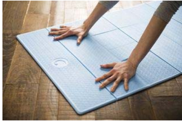
熱可塑性エラストマーと天然ゴムを配合したハイブリッド素材を採用