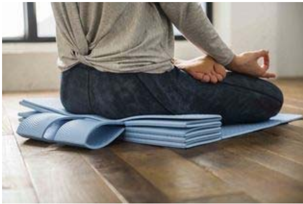
左右の坐骨が適度に沈みこむ、独自デザイン