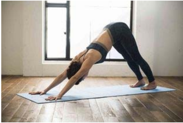
ヨガマットとしての機能性も優れている