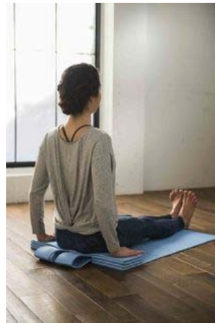
ヨガポーズも心地よくサポートする