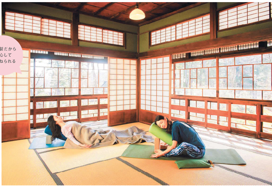
日本製だから安心してゆだねられる

オシャレだから、使いやすいからと、単純な理由で選んでいた『ヨガワークス』のプロダクトが、誰かの笑顔につながっていたとは…。何をどう選ぶのか、これからはプロダクトを利用する側も、賢く選択するための想像力が必要になってくるのかもしれない。