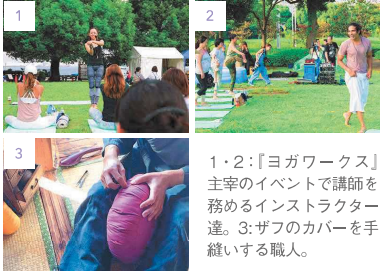
1・2:『ヨガワークス』主宰のイベントで講師を務めるインストラクター達。3:ザフのカバーを手縫いする職人。

私達はインストラクターと一対一でヨガを楽しんでいるように思いがちだが、実はその背景にはプロダクトを開発する『ヨガワークス』や、プロダクトを作る職人の存在もある。その誰一人として欠けてはならず、モノ（商品）や感謝の気持ち、生活の糧（豊かさ）を通して循環し、さまざまな形の豊かさを手にしている。