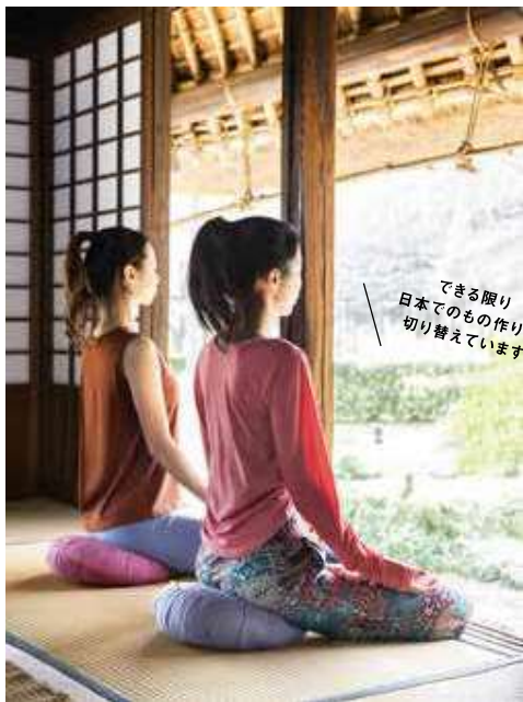
海外からの輸入商材は輸送時にCO2を大量に排出してしまうため、エコの観点からできる限り日本で製造。現在、ヨガザフ、ボルスタ一、サンドバッグ、ヨガブランケットがメイドインジャパン。